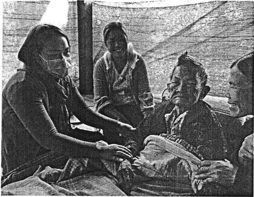
การเยี่ยมบ้านมิให้บริการที่บ้าน