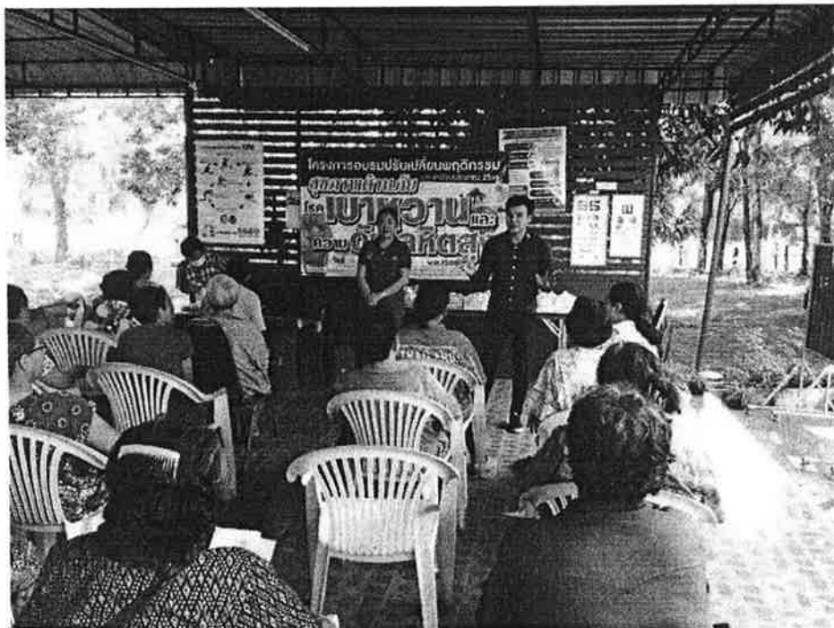
การอบรมให้ความรู้แก่ผู้ป่วยเบาหวานและความดันโลหิตสูง