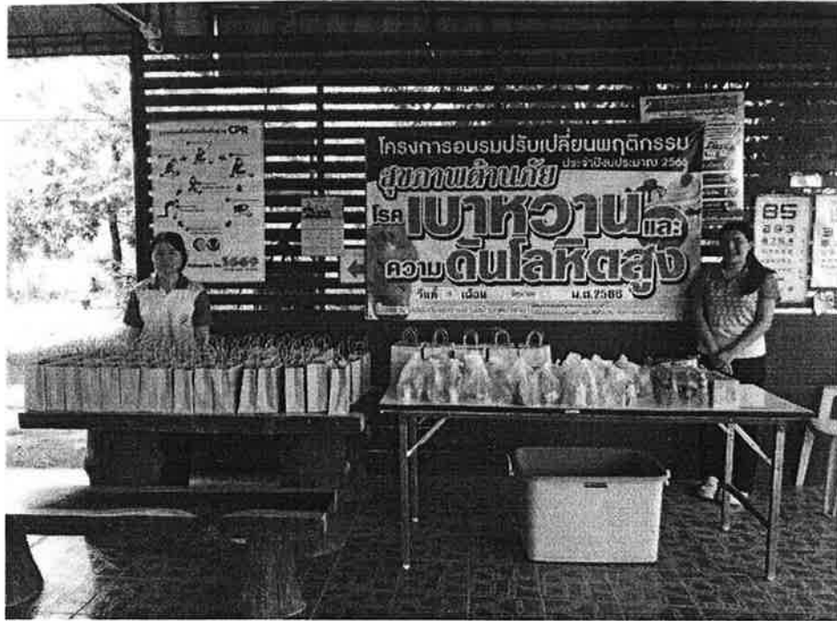
ป้ายโครงการและอาหารว่างสำหรับผู้เข้ารับการอบรม