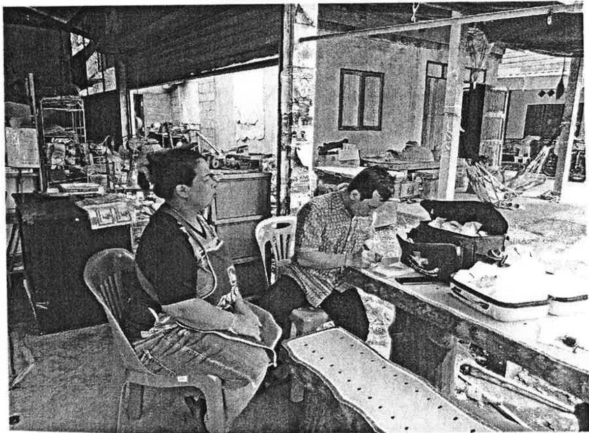
ออกติดตามเยี่ยมผู้ป่วยที่บ้าน