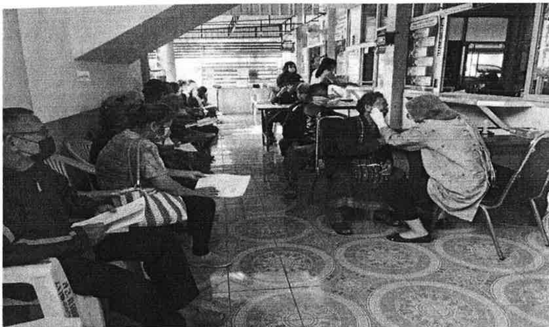
การตรวจฟันให้แก่ผู้ป่วยเบาหวานและความดันโลหิตสูง