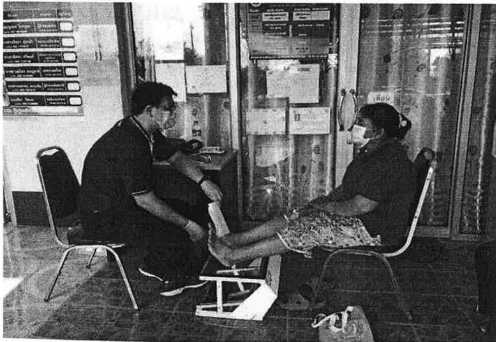
การดูแลเท้า/วัดรองเท้าให้กับผู้ป่วยเบาหวาน