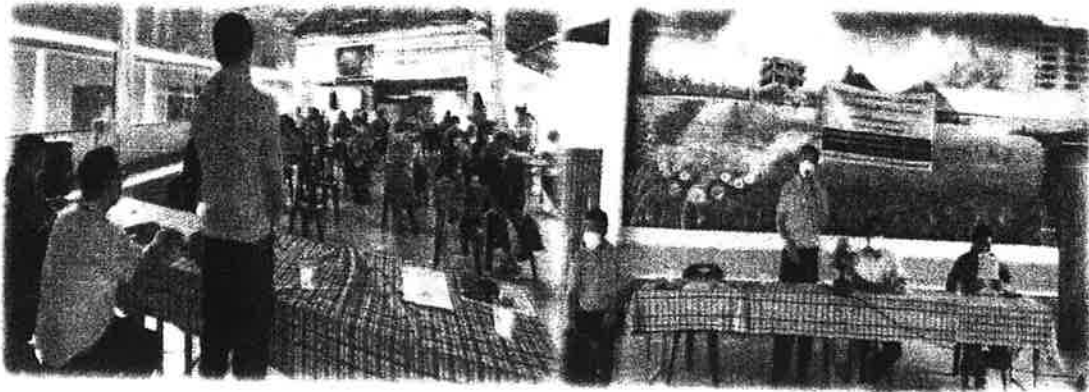
ภาพการประชุม และ คัดแยกขยะ